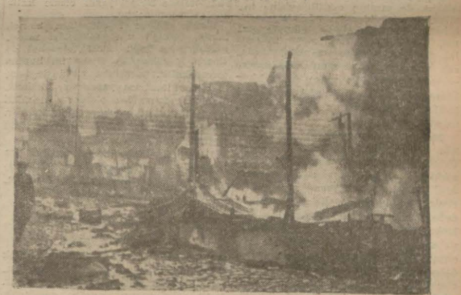
Yangından bir görünüş

Dün Fener yangınında 94 ev, 2 cami ve bir mescidin yandığı kat'i surette tesbit edilmiştir. Dün yangın devam ettiği sırada çıkan gazetelerde, alman kadirlerinin ilk yaptıkları tahmine nazaran, yanan binaların üç yüzden fazla olduğunu yazılmıştır. Yangından sonra yapılan tetkikler sonunda yanan binaların 94 olduğu a'aksama doğru anlaşılmıştır. Yangını etrafında alman kadirlerinin ilk yaptıkları tahmine nazaran, yanan binaların üç yüzden fazla olduğunu yazılmıştır.