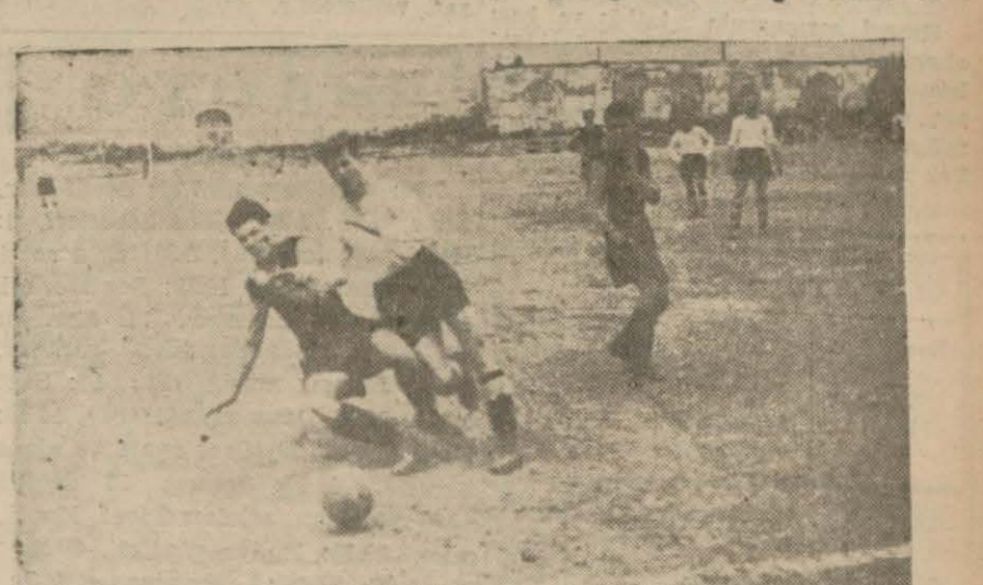
Beşiktaş - Beyoğluspor maçından heyecanlı bir sahfa

Fenerbahçe Kasımpaşayı 4-0, G. Saray Tak-simi 7-0, Beşiktaş da Beyoğluyu 8-0 yendiler