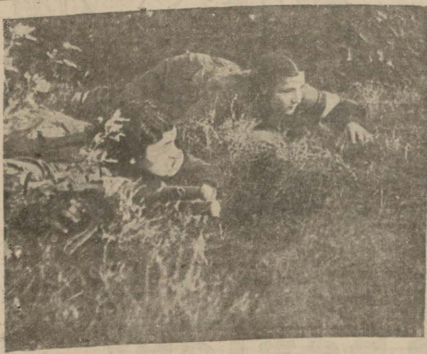
Sovyet kadını askerlerinden ikisi cephe

Londra, 22 (A.A.) — Suriyeden alınan bir habere göre yeni Suriye hükümeti bir beyanname nesretmiş ve müttfiklerle teşriki mesai edeceğini ilan etmiştir.