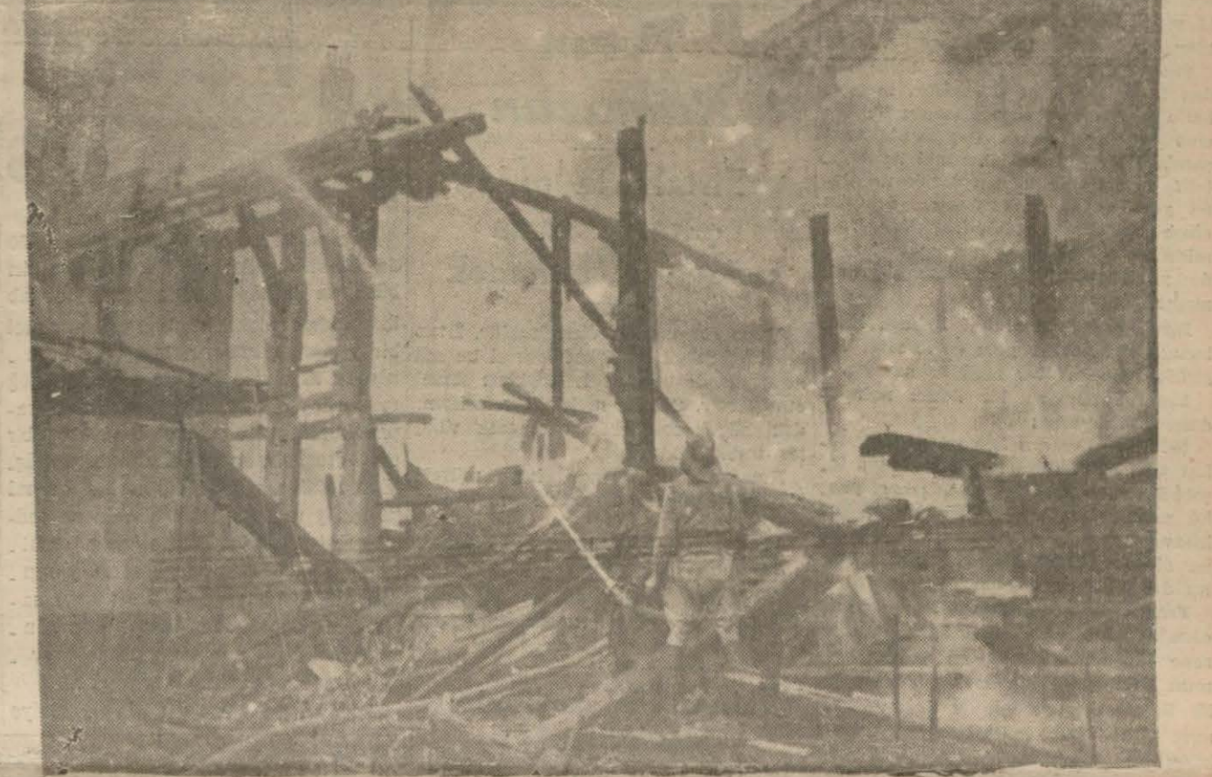
Ateşin çıktığı Patrikhane büro ve şametiğah kısmı yangından sonra

Harikzedelerden muhtac olanların giydirilmeleri, yedirilmeleri ve oturtulmaları Belediye ve Kızılay tarafından müstereken temin edildi